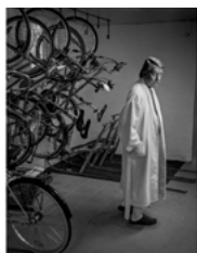
Kjell Lönnå Fine Art Print 58 x73 cm, ed 19 12 000 :-