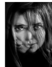
Lykke Li Fine Art Print 58 x73 cm, ed 19 12 000 :-