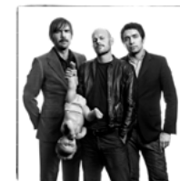
Peter, Bjorn & John Fine Art Print 110 x 110 cm, ed 19 50 000 :-