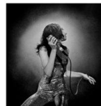
PJ Harvey Fine Art Print 110 x 110 cm, ed 19 Sold out