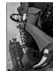
Nick Cave Fine Art Print 58 x73 cm, ed 19 12 000 :-