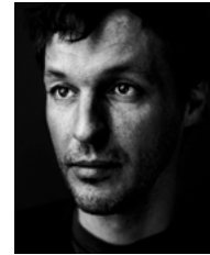
Olle Ljungström Fine Art Print 100 x 140 cm, ed 19 50 000 :-