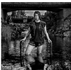
Brända Halsmandlar (aka Sara Vide Ericson) c-print 24x30 cm, ed 19 3 000 :-