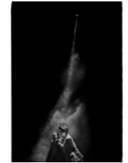
Joakim Thåström Fine Art Print 70 x 97 cm, ed 19 22 000 :-