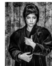
Angel Olsen Fine Art Print 58 x73 cm, ed 19 12 000 :-