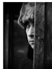
Bobby Gillespie Fine Art Print 58 x73 cm, ed 19 12 000 :-