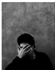
Lou Reed Fine Art Print 58 x73 cm, ed 19 12 000 :-