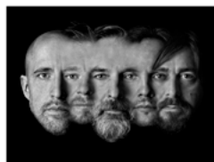
Oddjob Fine Art Print 58 x73 cm, ed 19 12 000 :-