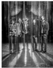
Amason Fine Art Print 58 x73 cm, ed 19 12 000 :-