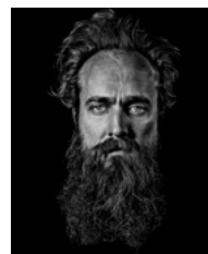
Iron & Wine Fine Art Print 100 x 140 cm, ed 19 50 000 :-