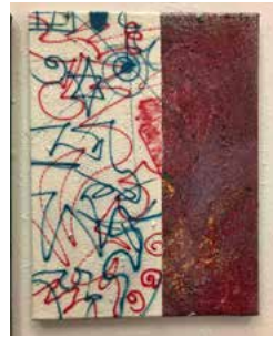
5. "ye I think he ran out of holidays" 2020, 30 x 40 cm 5700 kr