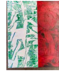
12. "I have no time to go there today, let's check it tmrw" 2021, 50 x 60 cm 12500 kr