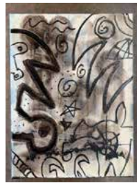
7. "I will throw mine in the Aegean sea" 2021, 30 x 40 cm 4600 kr