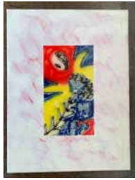
3. "I am devastated from yesterday so I'm home and I don't think I'll go to far" 2020, 30 x 40 cm 5700 kr