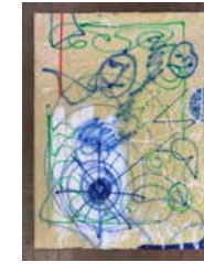
8. "yesterday I had an uneasy breathing also" 2021, 30 x 40 cm 5700 kr