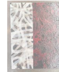
14. "If I know I am in your mind then I am fine" 2021, 40 x 50 cm 6400 kr SÅLD