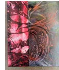
11. "But there is a big couch I think u can sleep on" 2021, 50 x 60 cm 12500 kr