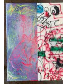
4. "... then I have my scumbag life back" 2020, 30 x 40 cm 5700 kr