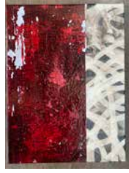
1. "Just write, I have time, all good" 2021, 30 x 40 cm. 5700 kr