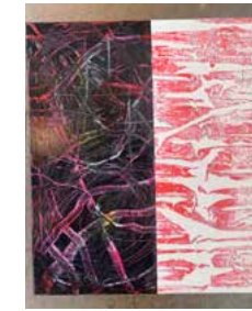
13. "Need to get some security for the landlord" 2021, 50 x 60 cm 12500 kr