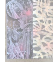
10. "But they told me this is what the jury said pt. 2" 2021, 50 x 60 cm 12500 kr SÅLD