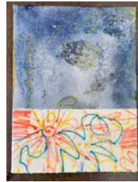
6. "But Im very happy u are coming" 2021, 30 x 40 cm 5700 kr