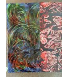
9. "I was in the car so I didnt feel it" 2021, 50 x 60 cm 12500 kr