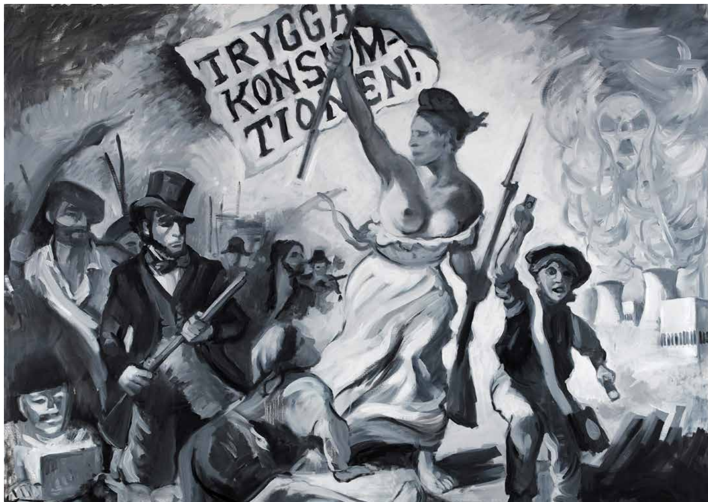
Trygga konsumtionen, 2011, 180*182 cm , olja/duk.