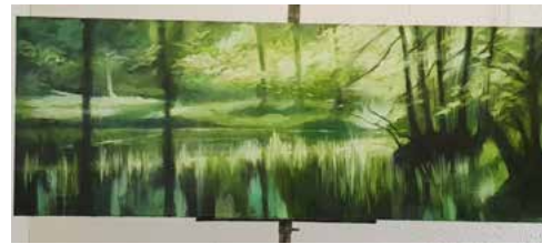
Långkärr 2020 65x180 cm Olja/duk 65. 000 kr