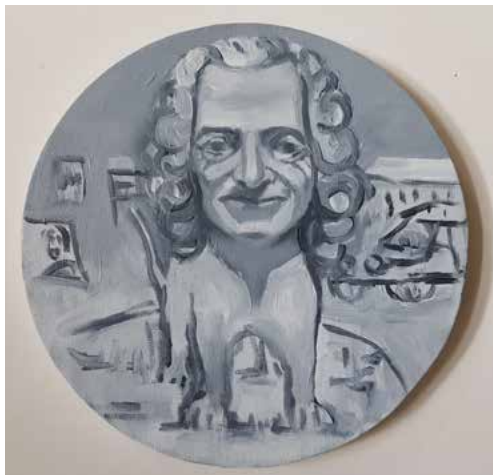
Voltaire som rondellhunden 2016 30 cm diameter Olja/duk 23. 000 kr