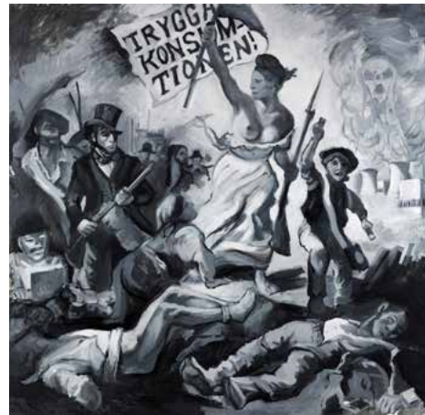
Trygga Konsumtionen 2011 180x182 cm Olja/duk 140. 000 kr