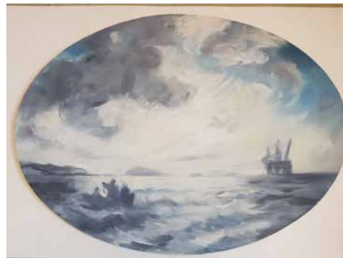
Gudfjorden med oljerigg 2020 51x71 cm (oval) Olja/duk 34. 000 kr