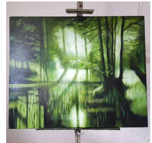
Höga Kärrret 2020 82x100 cm Olja/duk 48. 000 kr