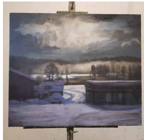
En reva i himlen 2020 72x85 cm Olja/duk 44. 000 kr