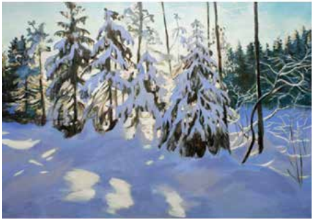
Stora Vintersmycke 2017 135x200 cm Olja/duk 120. 000 kr