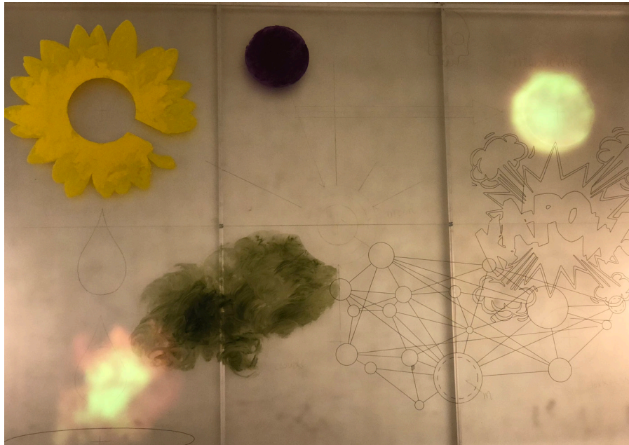
Intoxication, Influence and Sun (flowchart),