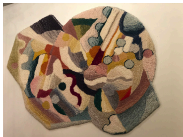
"Colour machine" 2017, 33.000-