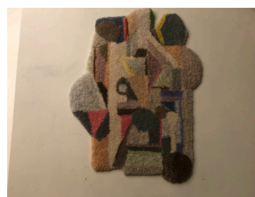
"Fragments 2", 2019, 11.000-