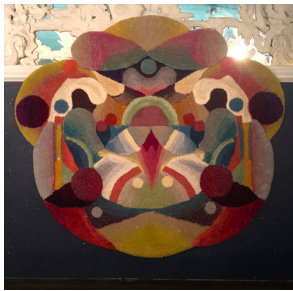
"Chroma 2" 2019 67.000-