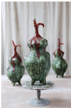
Sara Möller Frukten, 2018 SAK EDITION # 3 2018 Glaserad porslinslera Uppl. 25 Pris: 4900:-/styck (till salu)