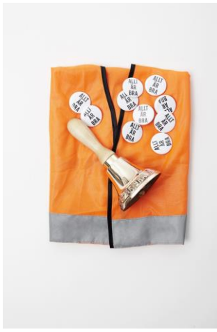
Ulrika Sparre Allt är bra SAK EDITION # 3 2015 Klocka i brons, handtag av trä, väst och pins Uppl. 30 Pris: 3600:-/styck (till salu)