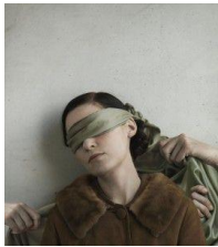
Lovisa Ringborg La Belle Indifférence , 2011 SAK Edition # 2 2011 Fotografi C-print Uppl. 30 (ej till salu)