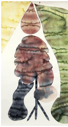
Sara Möller Översvall , 2015 Akvarell (ej till salu)