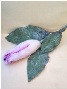
Roland Persson ”Skört samtal”, 2017 SAK EDITION 3 2017 Teknik: infärgat silikon Mått: ca 30 x 18 x 5 cm Uppl. 50 Pris: 4500:- /styck (till salu)