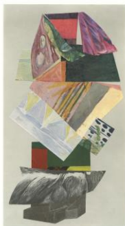
Malin Gabriella Nordin Begynnelser, 2017 SAK Edition # 2 2017 Collage på papper Uppl. 30 (ej till salu)