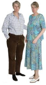
Karlsson Rixon Dubbelporträtt, 2013 SAK Edition # 2 2013 Pigment print Uppl. 30 Pris: 3000:- (till salu)