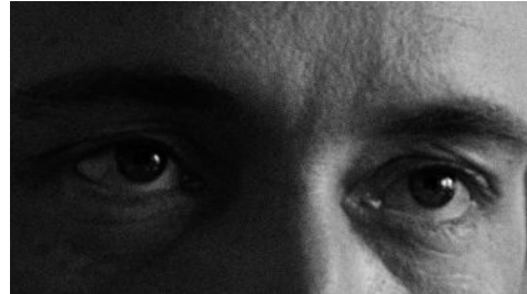
Eye of the Tiger (Keyser Söze) 72 x 52 cm 2024 2+1 ap 22.000 kr