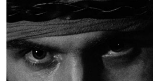
Eye of the Tiger (Luther) 72 x 52 cm 2024 2+1 ap 22.000 kr