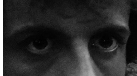
Eye of the Tiger (John J. Rambo) 72 x 52 cm 2024 2+1 ap 22.000 kr