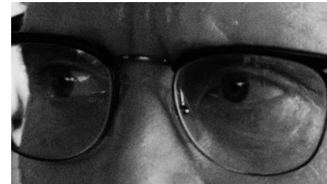
Eye of the Tiger (William "D-Fens" Foster) 72 x 52 cm 2024 2+1 ap 22.000 kr