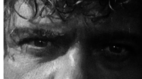
Eye of the Tiger (Mattis) 72 x 52 cm 2024 2+1 ap 22.000 kr