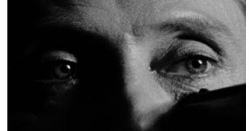
Eye of the Tiger (Brad Whitewood Sr) 72 x 52 cm 2024 2+1 ap 22.000 kr

VERKEN ÄR TILL SALU kontakt; calle@riche.se