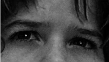
Eye of the Tiger (Conan the Barbarian) 72 x 52 cm 2024 2+1 ap 22.000 kr