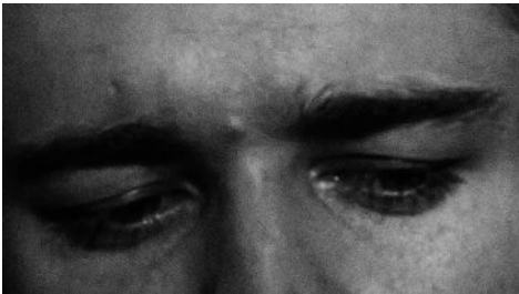
Eye of the Tiger (Hando) 72 x 52 cm 2024 2+1 ap 22.000 kr