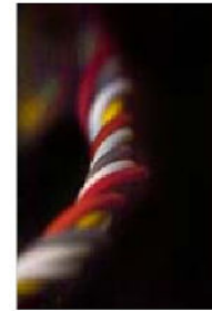
TRANSMISSION, SEK 3 000. Upplaga: 20.