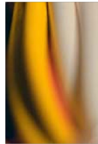
TENDER, SEK 3 000. Upplaga: 20.