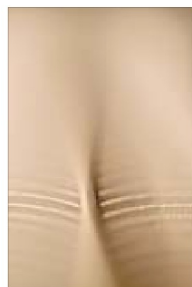
BASE, SEK 3 000. Upplaga: 20.