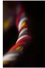
TRANSMISSION, SEK 3 000. Upplaga: 20.