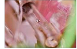
EAGER, SEK 3 000. Upplaga: 20.