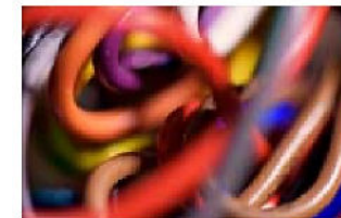
KARIN, SEK 3 000. Upplaga: 20.

Vid intresse kontakta; Carl Carboni, konst@riche.se Felix Mannheimer, felix@scamgalley.com