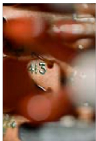
413, SEK 3 000. Upplaga: 20.